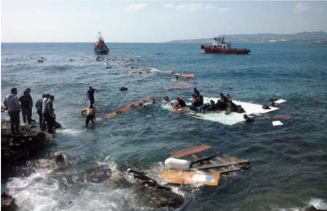
2019 – Король Малайзии Мухаммад V отрёкся от престола.