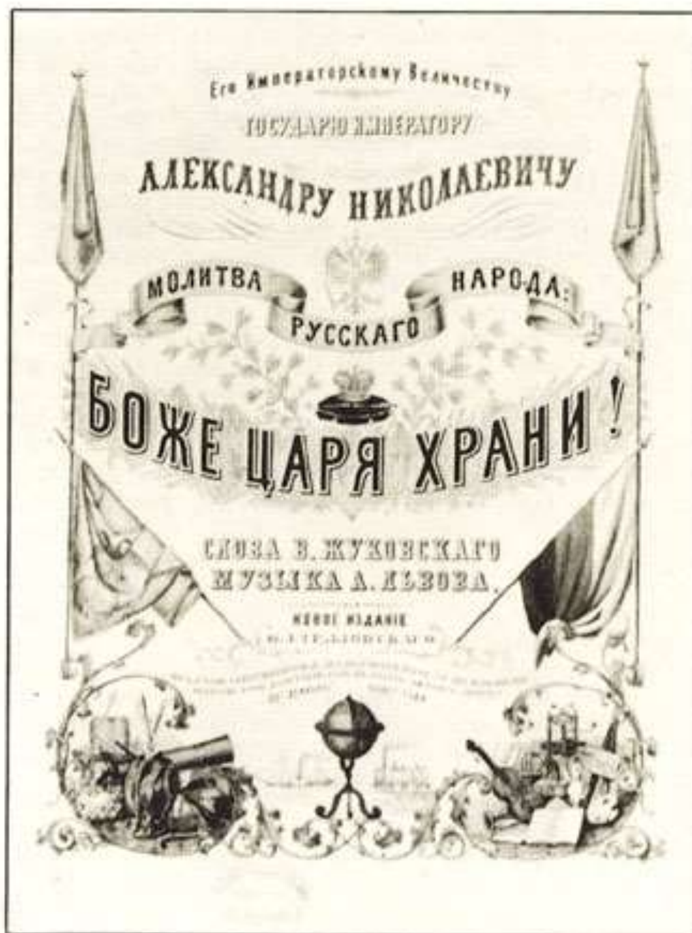
1838 – Открытие памятников М. И. Кутузову и М. Д. Барклаю-де-Толли перед Казанским собором в Петербурге